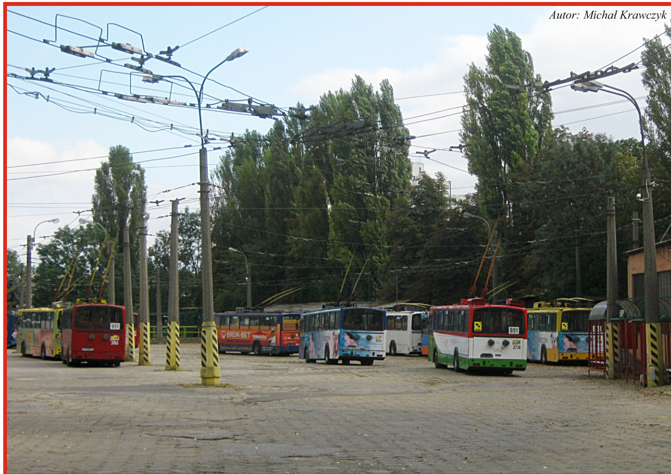
Autor: Michał Krawczyk