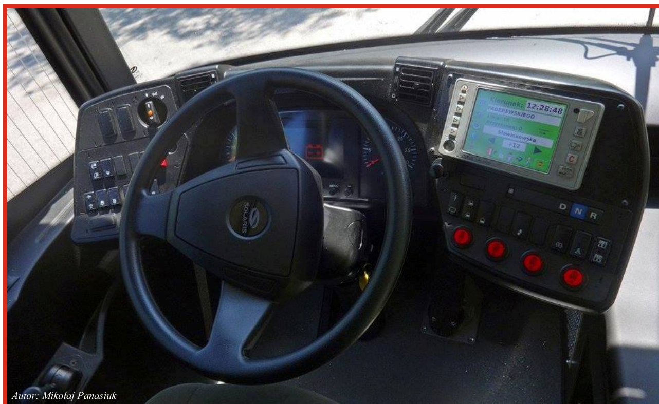
Autor: Mikołaj Panasiuk