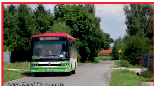
Autor: Kamil Piwowarczyk