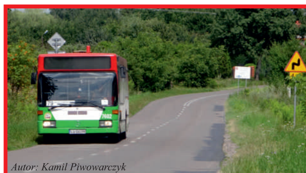
Autor: Kamil Piwowarczyk