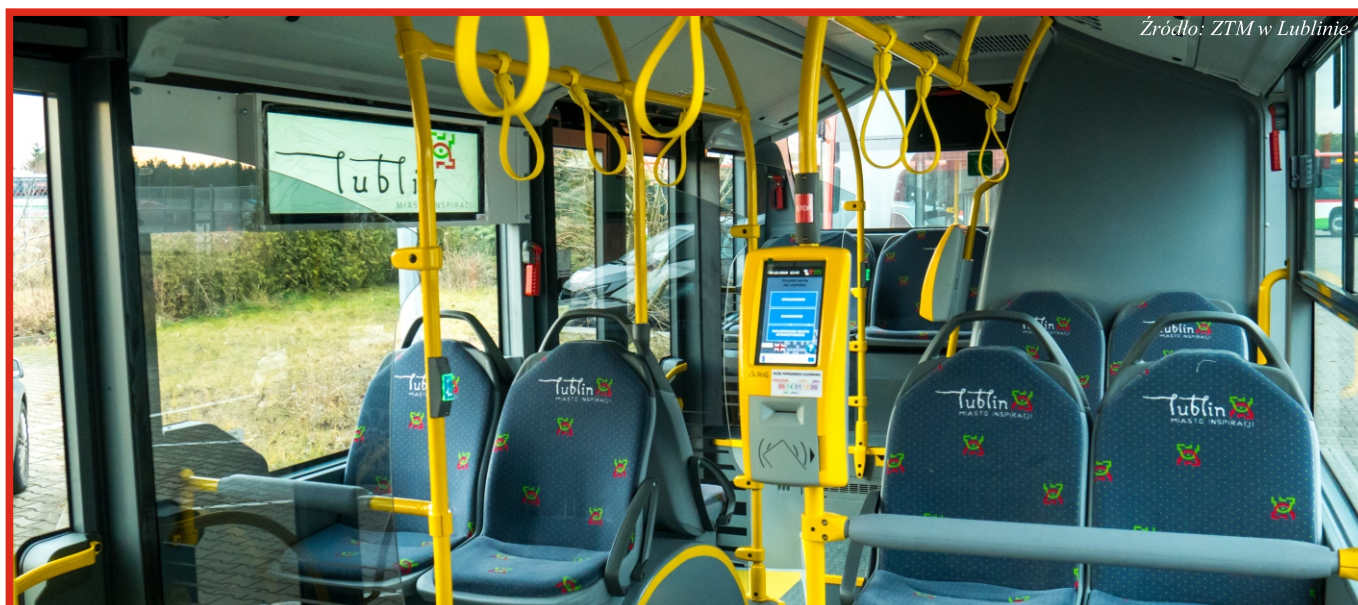
Źródło: ZTM w Lublinie