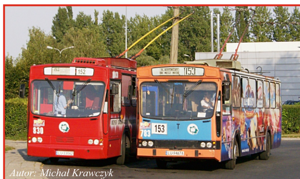
Autor: Michał Krawczyk

Średnia wieku eksploatowanego wówczas taboru wynosiła ok. 14 lat i tylko co drugi autobus był pojazdem niskopodłogowym. W przypadku trolejbusów było jeszcze gorzej – tylko 4 pojazdy były niskopodłogowe.