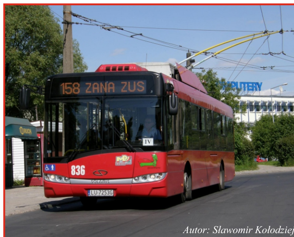
Autor: Sławomir Kołodziej