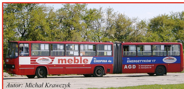
Autor: Michał Krawczyk