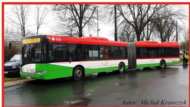
Autor: Michał Krawczyk

Oprócz linii specjalnych wprowadzono zmiany w funkcjonowaniu innych linii komunikacyjnych.