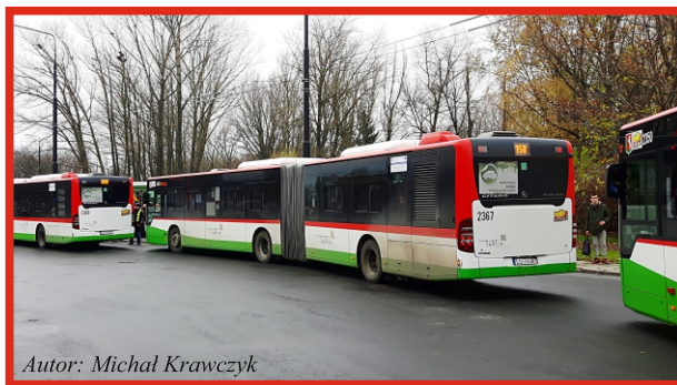
Autor: Michał Krawczyk

Linie nr 4, 8, 21, 22, 23, 47, 55, 73, 78, 153, 156, 158, 159 i 161 kursowały na podstawie specjalnych rozkładów jazdy wykonując większą liczbę przejazdów niż w standardowy dzień świąteczny. Ponadto uruchomione zostały linie nr 16, 52 i 85, które w dni świąteczne nie kursują, oraz do obsługi linii nr 8, 20, 23, 47, 55, 153, 156, 158, 159 i 161 skierowany został tabor przegubowy, a do obsługi linii nr 16 i 22 wyznaczone zostały autobusy 12-metrowe zamiast pojazdów klasy midi.