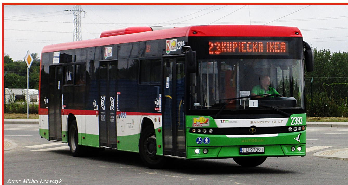
Autor: Michał Krawczyk