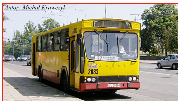
Autor: Michał Krawczyk

Wśród ciekawostek taborowych warto wymienić: