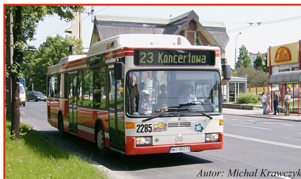
Autor: Michał Krawczyk