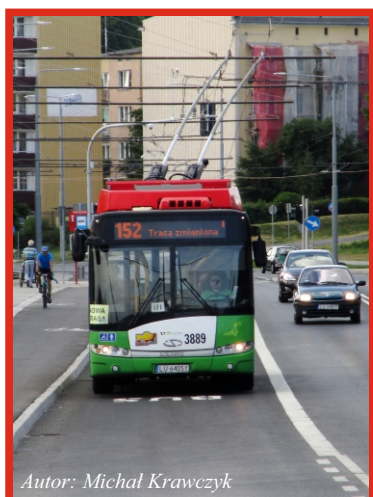
Autor: Michał Krawczyk