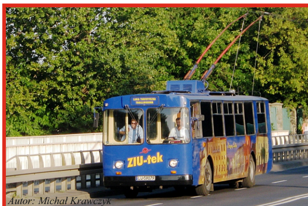
Autor: Michał Krawczyk