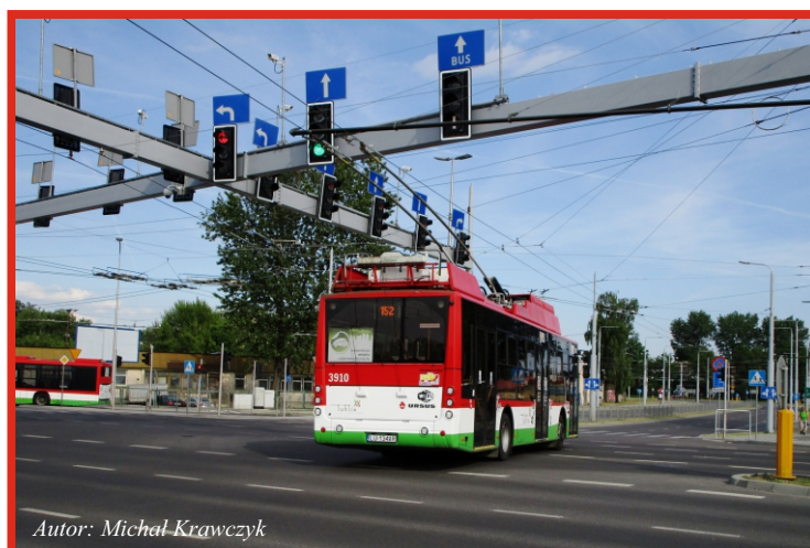
Autor: Michał Krawczyk