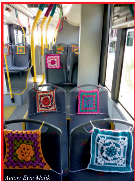
Autor: Ewa Molik