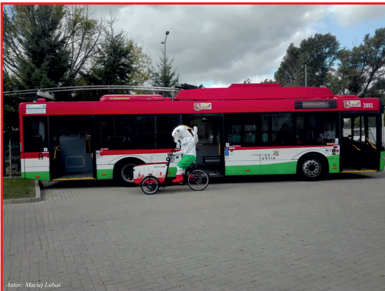
Autor: Maciej Lubaś