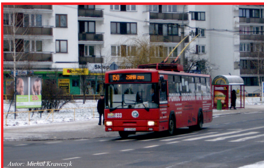
Autor: Michał Krawczyk