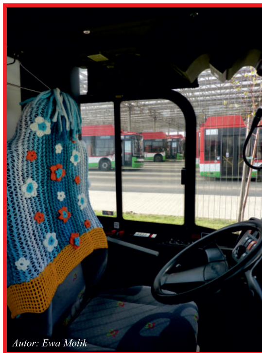
Autor: Ewa Molik