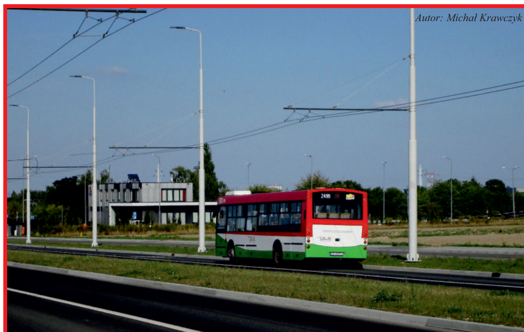
Autor: Michał Krawczyk