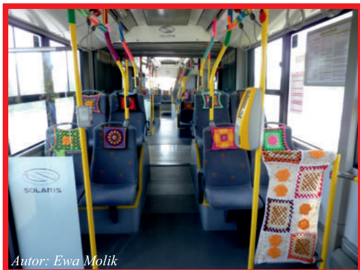
Autor: Ewa Molik