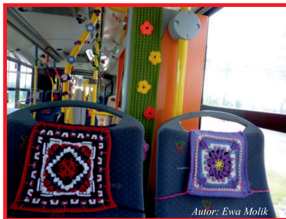
Autor: Ewa Molik